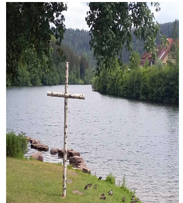
Vorsperre der Nagoldtalsperre

Anmeldung: Ab sofort, spätestens beim Biergartenstammtisch im August!