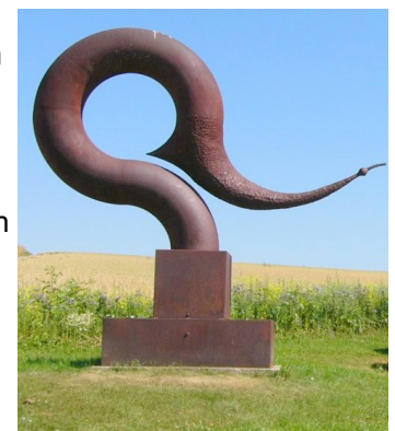
moderne Skulptur von L.A.